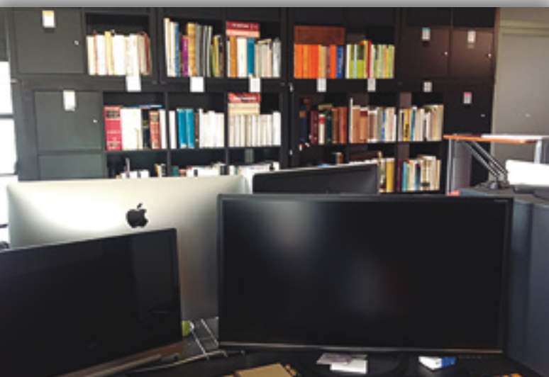
Local de la Fundación Digital Bible