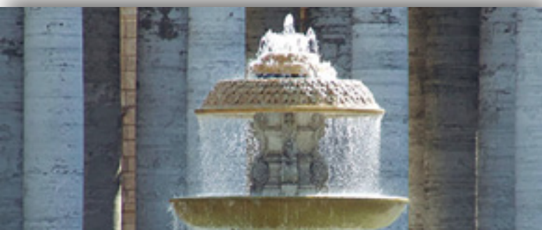
Vaticano, Pontificia Comisión A. Latina

Contactos con la Pontificia Comisión para América Latina. Se ha contactado con esta Comisión para poder difundir el proyecto por América Latina y abrir la posibilidad para que se conozca en el CELAM. Desde estos contactos se ha podido abrir la posibilidad de realizar un encuentro en el año de 2017 con la Secretaria de Comunicación del Vaticano para difundir este proyecto.