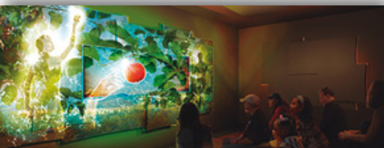
Recreación de una sala del Museum of the Bible, Whashington

Contactos con responsables del Museo de la Biblia de Washington. Se ha retomado el contacto con los responsables del Museo y en diciembre se ha vuelto a contactar para analizar una posible colaboración. Desde la Fundación estamos pendientes de elaborar un vídeo explicativo de lo que es el Proyecto eBible y su posible aportación al Museo de la Biblia.