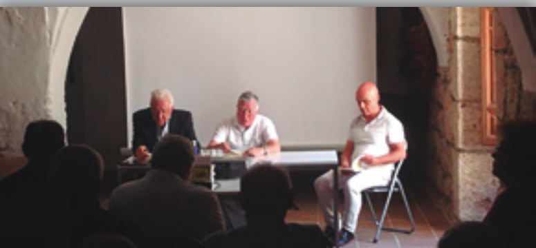
Presentación de Claros Menhires en El Toboso, 13.08.2016