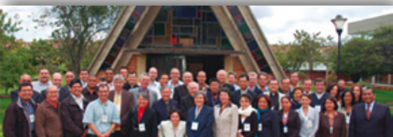
RIIAL, red de agentes de pastoral digital y de la comunicación

Se ha abierto un contacto con los responsables de la red de difusión RIIAL para examinar la posibilidad de que el proyecto eBible esté presente en esta red y así dar a conocer sus creaciones.